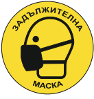
Sign DY01 200 mm