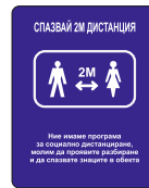
Sign DB05 200 x 250 mm