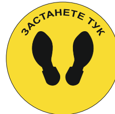
Sign FY05 350 mm