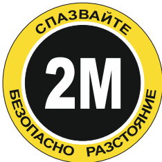
Sign FY03 350 mm