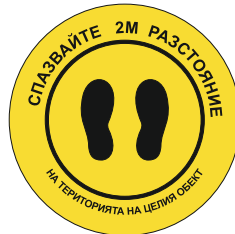
Sign FY04 350 mm