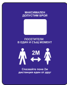
Sign DB03 200 x 250 mm