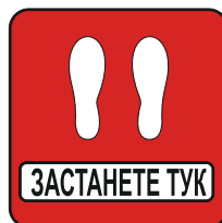
Sign FR08 300 X 300 mm