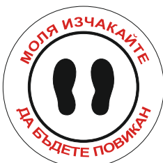
Sign FR07 350 mm