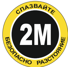
Sign FY03 350 mm