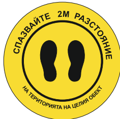
Sign FY04 350 mm