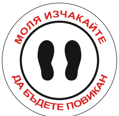
Sign FR07 350 mm