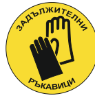
Sign DY02 200 mm