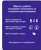
Sign DB04 200 x 250 mm