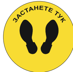
Sign FY05 350 mm