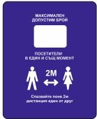
Sign DB03 200 x 250 mm