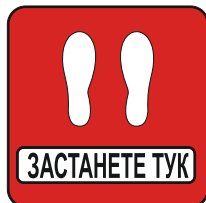
Sign FR08 300 X 300 mm