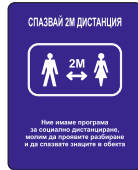
Sign DB05 200 x 250 mm